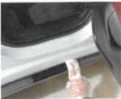
サイドガーニッシュ